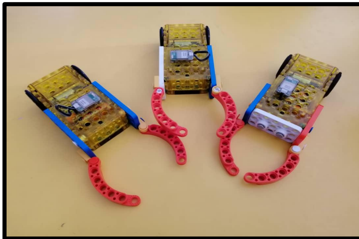
Robot pembersih yang telah siap